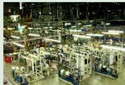
ELC Paraíba do Sul

produto de última geração Clipinlock 2 , já homologado por ela.