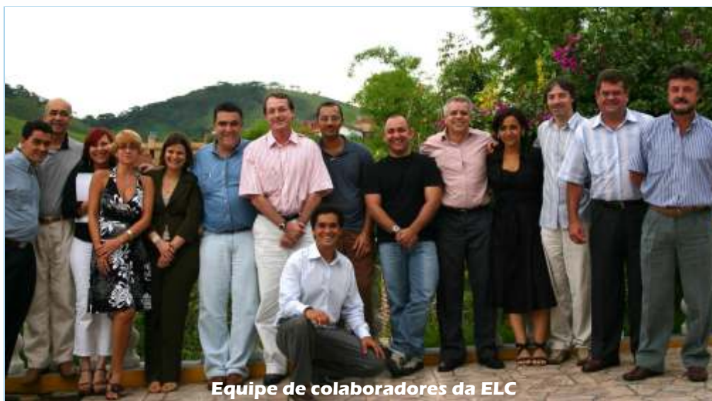
Equipe de colaboradores da ELC

Ainda nesta oportunidade tivemos uma palestra apresentada pelo nosso Diretor, focando estratégias para 2007 e apresentando os novos produtos a serem comercializados pela ELC. Seguiu-se uma visita de nossos Gerentes e Representantes à fábrica, acompanhados pelos Diretores e Gerente de Produção.