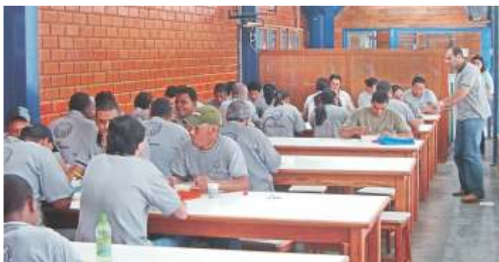
Inauguração do refeitório